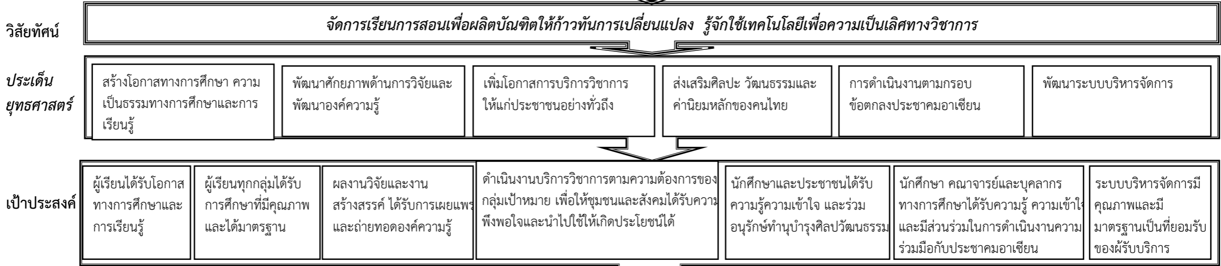
แผนที่กลยุทธ์ (Strategy Map)